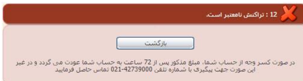
تصویر ۸-نمایش اخطار تراکنش ناموفق

با دریافت پیغام جهت مراجعه به پورتال، برای مشاهده وضعیت خود اقدام نمایید. از طریق پورتال سازمان امور دانشجویان سربرگ کارتابل را انتخاب نمایید.(تصویر ۹)