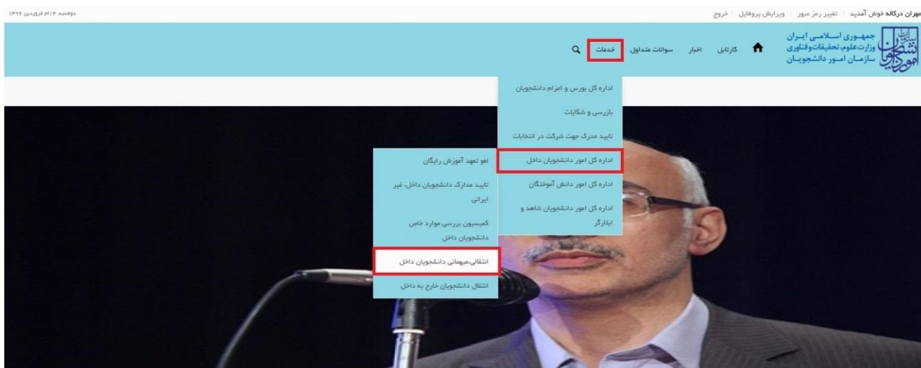
تصویر ۱-نمایش پورتال

توجه بفرمایید که متقاضی برای مشاهده این درخواست در منوی خدمات، باید حداقل یک مقطع تحصیلی کاردانی یا کارشناسی داخل کشور با وضعیت تحصیلی شاغل به تحصیل یا مرخصی تحصیلی (نوع دانشگاه غیر از پیام نور و جامع علمی کاربردی) یا یک مقطع تحصیلی داخل کشور دکتری حرفه ای در رشته دامپزشکی با وضعیت تحصیلی شاغل به تحصیل یا مرخصی تحصیلی در پروفایل ثبت نام خود داشته باشد. در صورت عدم مشاهده این درخواست، پروفایل خود را از طریق گزینه ویرایش پروفایل، اصلاح نمایید و سپس از منوی خدمات به ثبت درخواست مربوطه بپردازید.