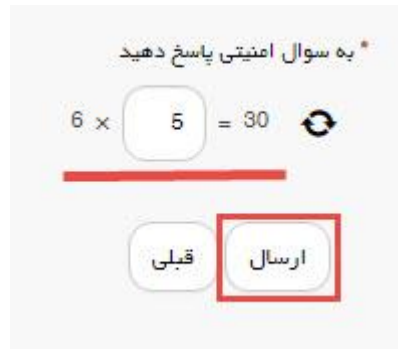
تصویر ۳-سوال امنیتی

سپس به سوال امنیتی پاسخ داده و بر روی دکمه ارسال کلیک کنید.(تصویر ۳)