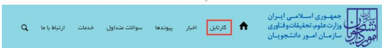
تصویر ۹-کارتابل شخصی

با دریافت پیغام جهت مراجعه به پورتال، برای مشاهده وضعیت خود اقدام نمایید. از طریق پورتال سازمان امور دانشجویان سربرگ کارتابل را انتخاب نمایید.(تصویر ۹)